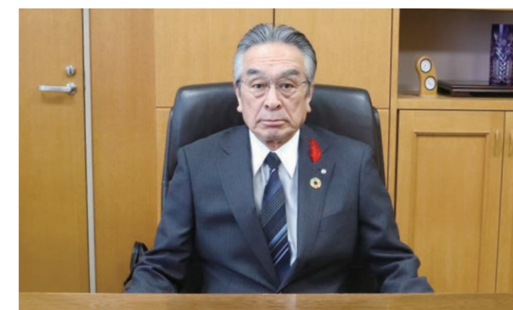
秩父別町長 澁谷 信人