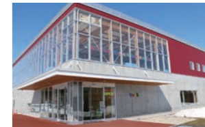
キッズスクエアちっくる