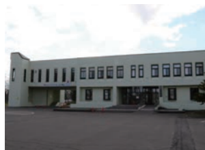
ファミリースポーツセンター