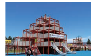
キュービックコネクション