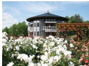
ローズガーデンちっぷべつ