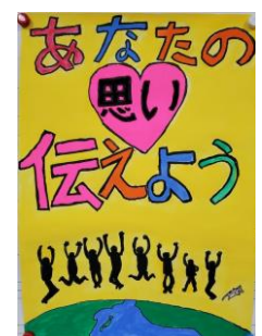
6年 石山史龍さん 作成のポスター