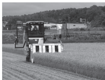
【稲刈り体験：日の出集落】