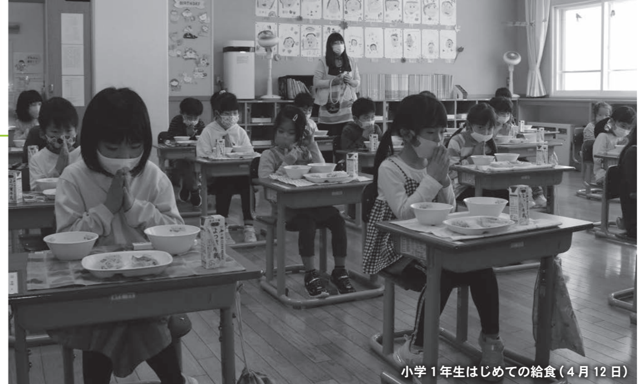
小学1年生はじめての給食(4月12日)

秩父別町では、人口減少対策、移住・定住、まちづくりを促進するため各種事業を実施しています。 その事業の詳細と予算額についてお知らせします。