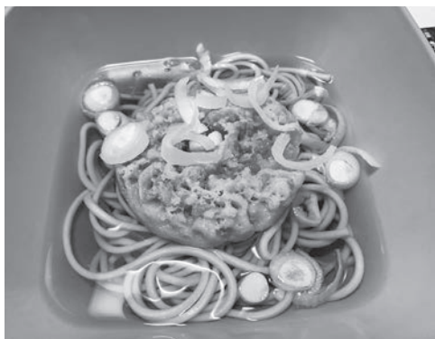
年末は日本の文化「年越しそば」を食べました