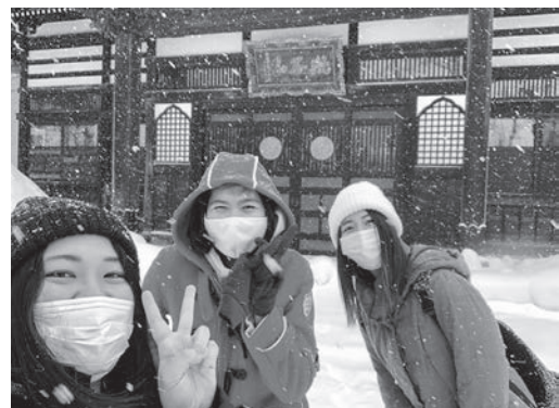
近隣のお寺に初詣