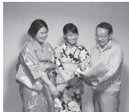
秩父別温泉で浴衣に着替え、日本文化を体験しました。

2人は、「タイでは北海道が人気で、函館や小樽などの観光名所よりも、あまり知られていない場所を探して旅行する人が多い」と話し、「秩父別町の良い所の温かさ、札幌からのアクセスの良さ、季節ごとに行われるイベントなどを中心に情報発信していきたい」と話しました。 町では、観光情報やイベント写真などの画像を提供して協力し、フェイスブックやYouTube、タイ国内最大級の掲示板サイト「パンチップ」を利用して情報発信される予定です。