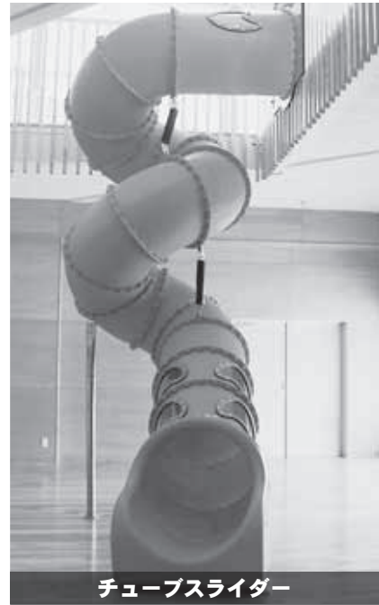
チューブスライダー

年齢に応じた「遊び」を通して、全身を思い切り動かし、人と関わり、家族の愛情や絆を感じながら、「生きる力」を育むことができる健全な成長空間です。