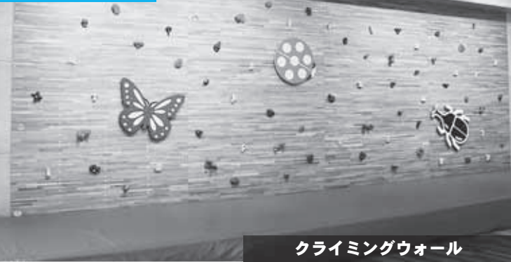
クライミングウォール