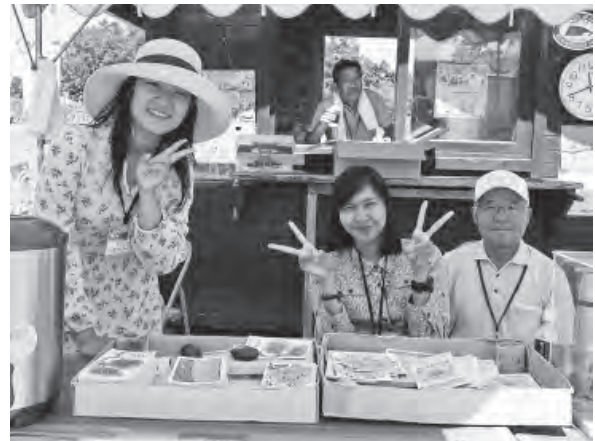
ひまわりの里で北竜ALTセルさんとボランティアの方々と