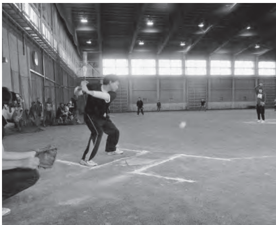
3試合で3本のホームランを記録した旭町内の強力打線！