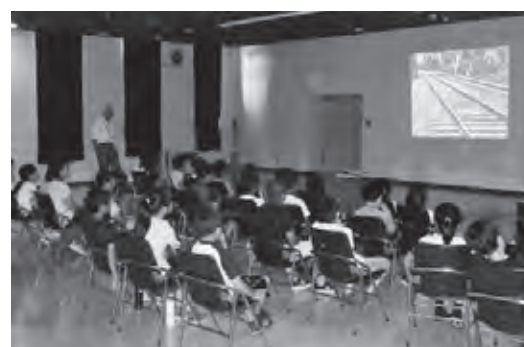
映画館のような雰囲気、秩父別町の足跡を鑑賞