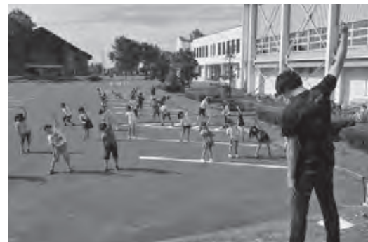
朝活は毎回、元気にラジオ体操からスタート！

また、2日（木）には郷土学習として、プロジェクターの大画面で本町の足跡を鑑賞しました。