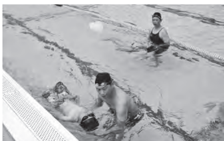
水に浮く練習の様子

また、今年も昨年に引き続き、水泳教室が始まる前に奉仕活動として小学生たちが会場となるB&G海洋センターの周りのゴミ拾いを行いました。