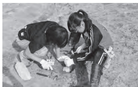
化石発掘体験の様子

2日目は、アクティブに活動した前日とは打って変わって、大光寺で梅澤住職による座禅体験と町内講師による茶道体験で心を整えた後、消防署で各種消防車輛等の説明を受けました。