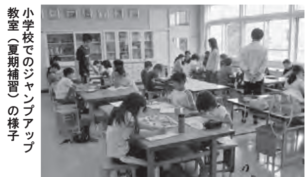
小学校でのジャンプアップ教室（夏期補習）の様子