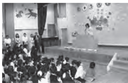
認定こども園保育料の軽減