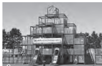
屋外遊戯場キュービクコネクション