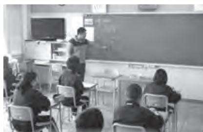
学習支援員の配置