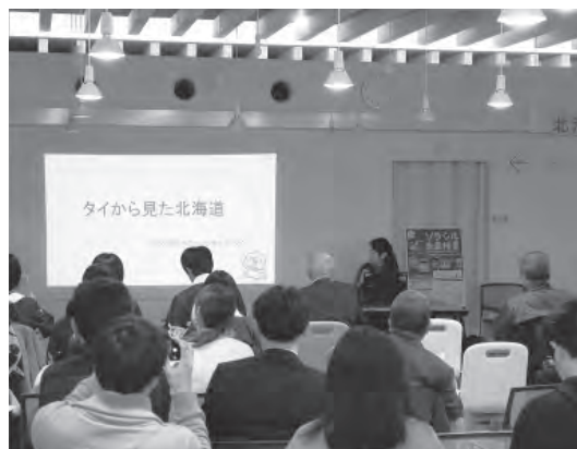
授業での発表の様子

これからも色んなイベントにも参加し、外国人に私が住んでいる秩父別町・北海道の魅力を伝えて、たくさんの観光客が来てくれるよう頑張っていきたいと思います。