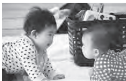
子ども包括支援センター事業