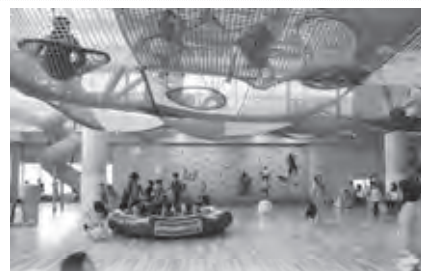
屋内遊戯場キッズスクエアちっくる