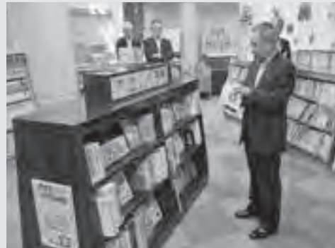
6月25日「かみやぶ文庫」 お披露目の様子