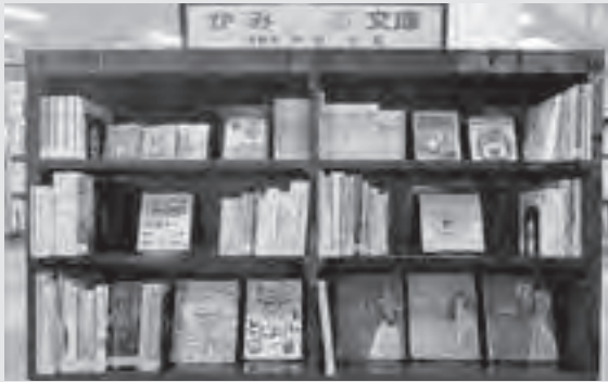
《東側の書架は絵本を中心に配置》 幼児向けの絵本を揃えています！