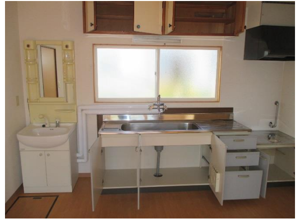
キッチン・洗面台